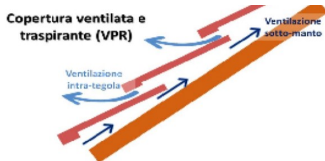
Figura 2: Una copertura ventilata e permeabile (VPR) caratterizzata da una ventilazione sotto-manto e intra-tegola.