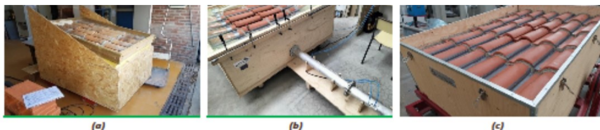
Figura 3: Apparecchiature per la misura della permeabilità presso il Centre Technique des Matériaux Naturels de Construction (a), l'Università Politecnica delle Marche (b) e il Centro Ceramico (c).